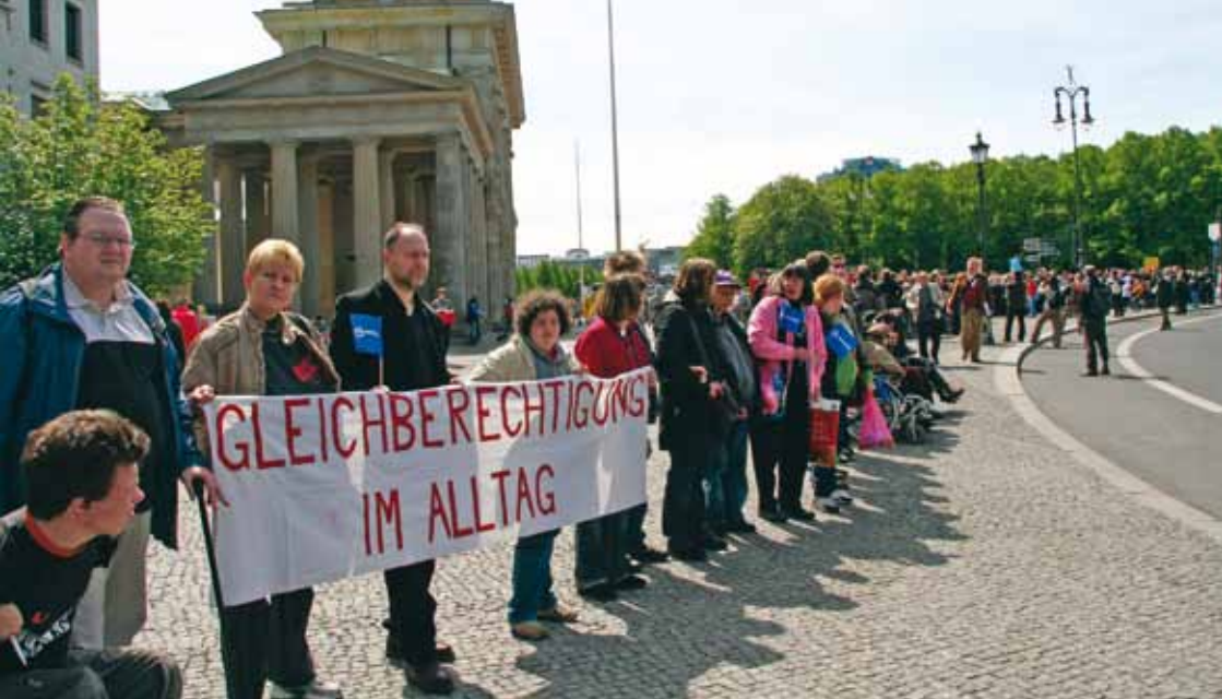
Vom Brandenburger Tor bis zum Sitz des Bundestages reichte die eindrucksvolle Menschenkette am Europäischen Protesttag zur Gleichstellung von Menschen mit Behinderungen am 5. Mai 2010