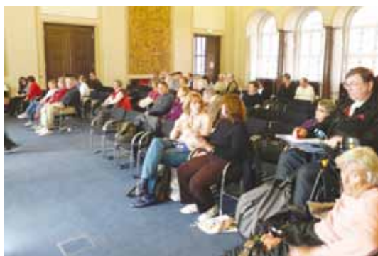
Ein interessiertes Publikum verfolgt die Ausführungen der Podiumsteilnehmer

Da muss man sich auch nicht wundern, dass es offensichtlich keine ausge-