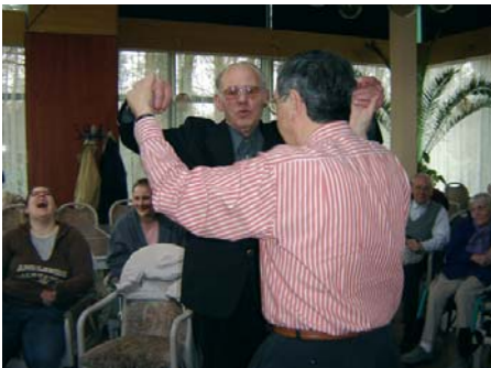
Aktiver Urlaub zu Lande, ...

Der Tagesablauf steht fest, die Angehörigen brauchen sich nicht mit der Urlaubsplanung zu beschäftigen.