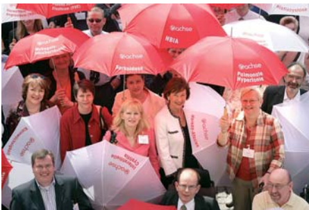
Teilnehmer an der Awareness Conference am 5. und 6. Mai in Berlin

Zahlreiche Betroffene wenden sich Hilfe suchend an die ACHSE. Sie fragen nach Informationen, spezialisierten Ärzten und Behandlungszentren oder möchten Kontakt zu anderen Betroffenen finden. Leider stehen oft entweder gar keine guten oder nur englischsprachige Informationen zur Verfügung. Die ACHSE ist deswegen dabei, eine Informationsdatenbank einzurichten. Dies wird eine Internetplattform sein auf der alle bestehenden guten Quellen zusammengeführt werden. Außerdem werden dort patientenorientierte Krankheitsbeschreibungen, die den ACHSE-Kriterien entsprechen, zur Verfügung gestellt. Zusätzlich ist die Einrichtung einer Beratungsstelle in Vorbereitung. Diese wird den Menschen den Weg zur passenden Selbsthilfeorganisation weisen oder individuelle und/oder psychosoziale Beratung bieten, wenn noch keine Diagnose gefunden ist oder keine diagnosespezifischen Selbsthilfegruppen vorhanden sind.