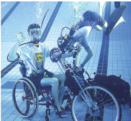
Training im Indoor-Tauchzentrum

Gegründet wurde er im Juni 2005 in Duisburg, nicht zuletzt aufgrund der hierzulande doch recht bescheidenen Bedingungen im Bereich des Behindertentauchsports. Der Verein erlangte sehr schnell durch seine Präsenz auf vielen Messen (Reha Care, Boot Düsseldorf usw.) sowie der Zusammenarbeit mit vielen Organisationen einen hohen Bekanntheitsgrad, selbst im Ausland kennen uns viele Einrichtungen und Tauchbasen. Der Verein wächst täglich nicht nur im Ruhrgebiet sondern auch durch die Ansprechpartner in ganz Deutschland.