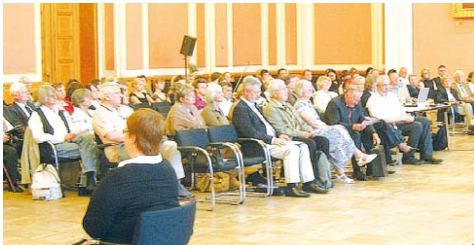
Blick ins Publikum während der Jubiläumsveranstaltung

Die Gesamtheit der nach diesen Regeln gebildeten und arbeitenden Vereine und Verbände bilden das "System Selbsthilfe chronisch kranker und behinderter Menschen". Alle Stufen und Ausprägungen gehören dazu, unter Einschluss der Landesvereinigungen und Landesarbeitsgemeinschaften Selbsthilfe sowie der BAG SELBSTHILFE mit ihren bundesweiten Mitgliedsverbänden. Da alle Vereinigungen präventive und rehabilitative Zielsetzungen verfolgen, sind sie auch sämtlich förderfähig seitens der Krankenkassen. Soweit sekundäre Rechtsquellen hier z. B. den Landesvereinigungen Selbsthilfe Beschränkungen auferlegen, müssen sie überprüft und durch gleichmäßige und für alle Selbsthilfebene geltende Regelungen ersetzt werden.