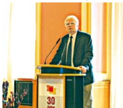
Herr Kuperion während seiner Rede im Festsaal des Roten Rathauses

Leider hat sich auf dem Gebiet der Anerkennung ehrenamtlicher Arbeit bei weiten nicht so viel getan, wie es